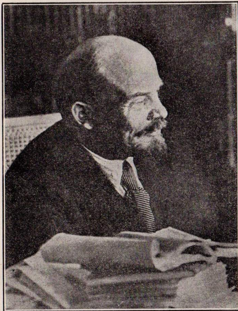
Lenin työpöytänsä ääressä

OLSON LIBRARY NORTHERN MICHIGAN UNIVERSITY MARQUETTE, MICHIGAN 49855